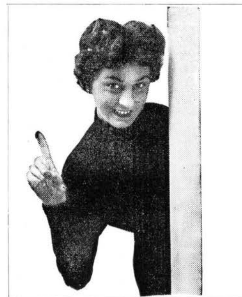
Seid lieb, wenn ihr im Kindergarten von 48/99 spielt

DUISBURGER TURN- U. SPORTVEREIN VON 1848/99